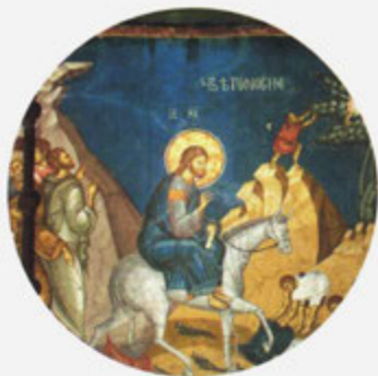
СВ. ПРОРОК ЗАХАРИЈА (6 векова ђре Христѡа)